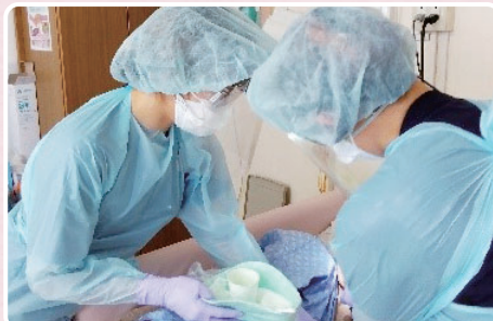
歯科衛生士と看護師との協働による口腔ケア