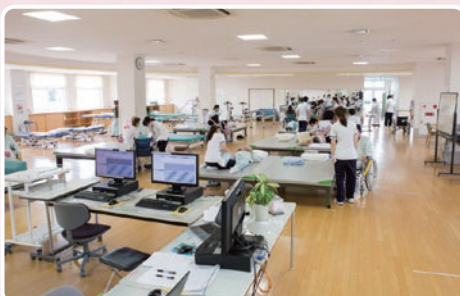
リハビリテーションセンター