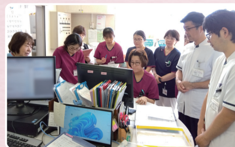
地域包括ケア病棟（多職種カンファレンス）